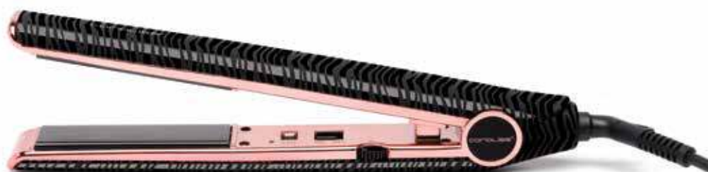
BLACK COPPER ZEBRA SOFT TOUCH