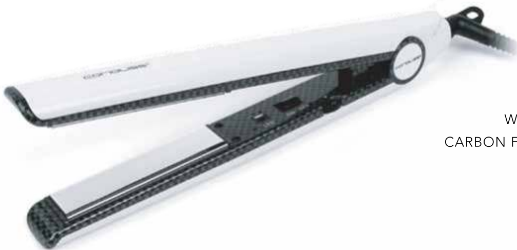
WHITE CARBON FIBER