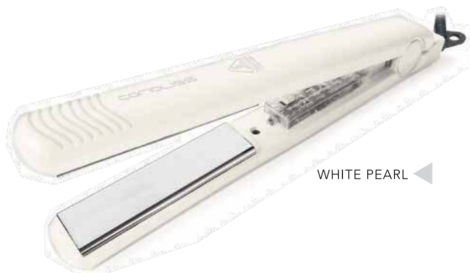
WHITE PEARL ◀