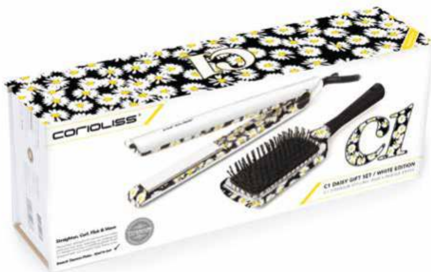
DAISY KIT WHITE BOX