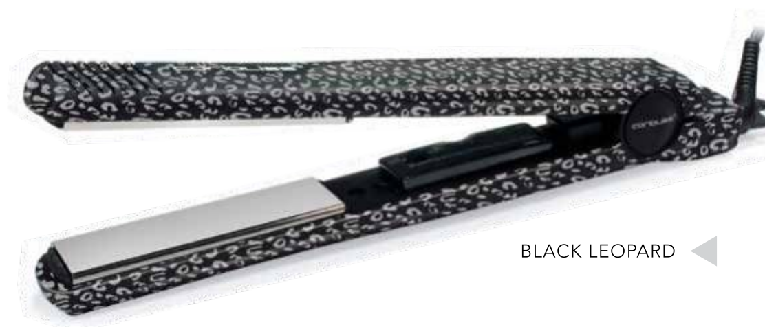
BLACK LEOPARD ◀