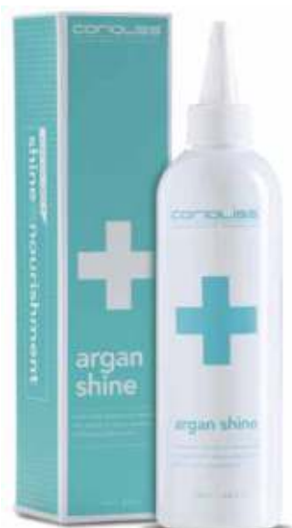
ARGAN SHINE TREATMENT PER PIASTRE K2 e K6 250ml