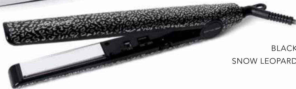
BLACK SNOW LEOPARD